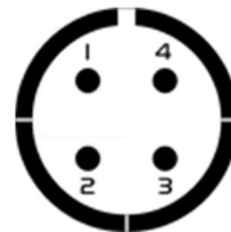
Stecker 711/719 4pin