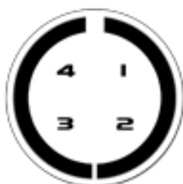
Binder 711, männlich, Lötansicht